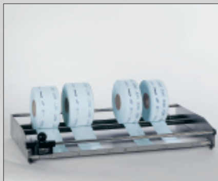
hm 631 S